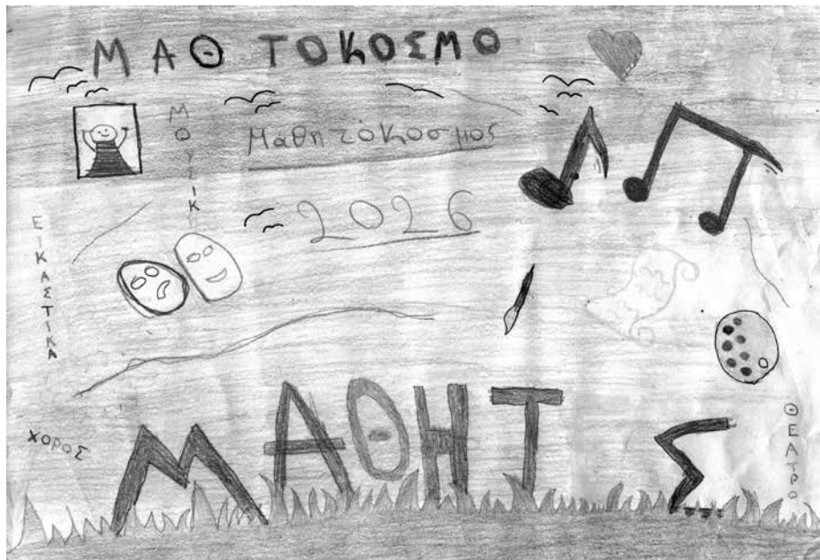
Επιμέλεια εικαστικών: Αλεξάνδρα Κατσάρη (7 ο Δημοτικό Σχολείο Σερρών)