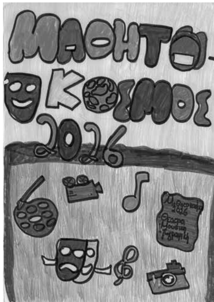
Επιμέλεια εικαστικού: Αγγελική Μπεχτσιά (7° Δημοτικό Σχολείο Σερρών, ΣΤ' τάξη)