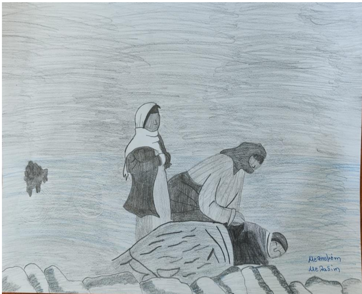
Μάνα που αποχαιρετάει το νεκρό παιδί της