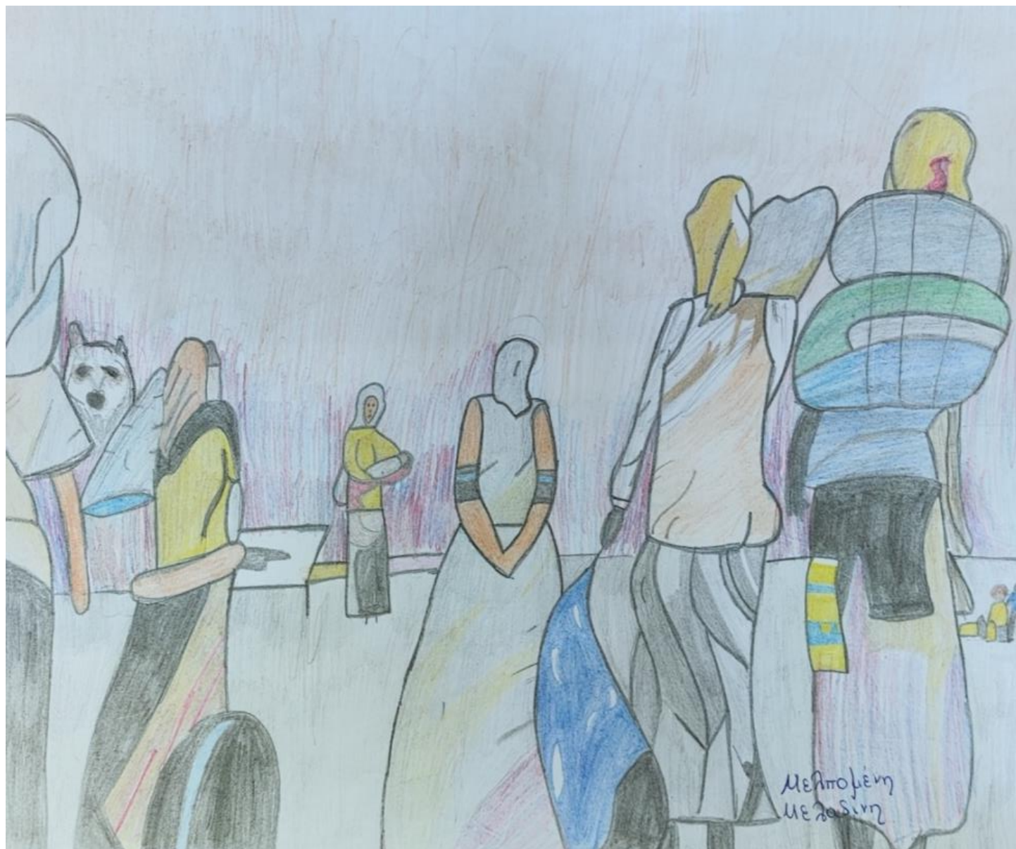
Πρόσφυγες με τα υπάρχοντά τους