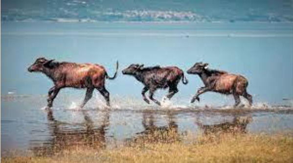
Le buffle de l'eau