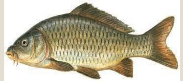
Le cyprinus carpio